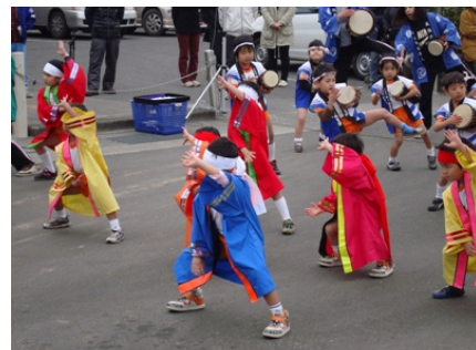
可愛い子供達の踊り

新鮮な野菜や果物、海産物、特産品等 軽トラの荷台に乗せて直接販売！ 格安商品がわっぜかずんばい！