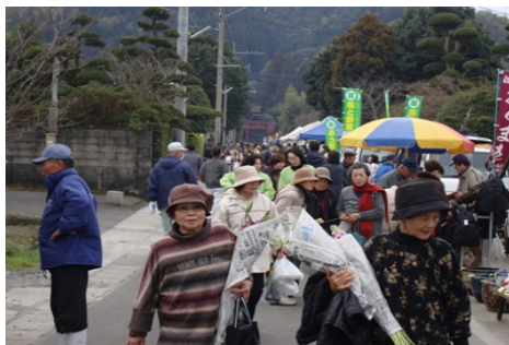
沢山の人出で賑わいました